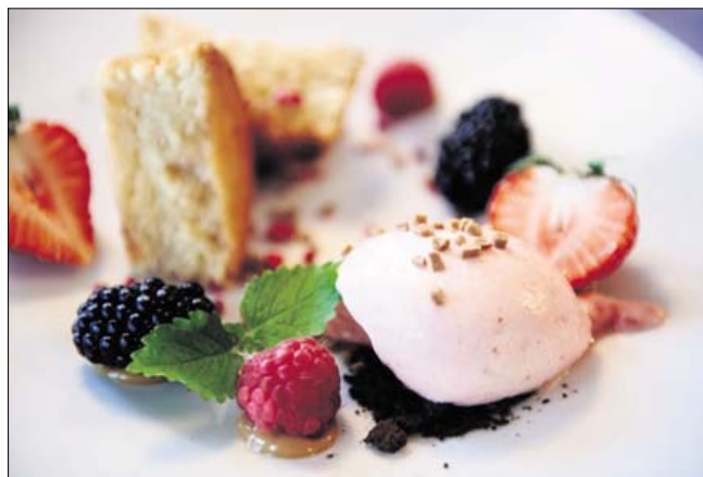
Du spiser særdeles godt i badehotellets restaurant.