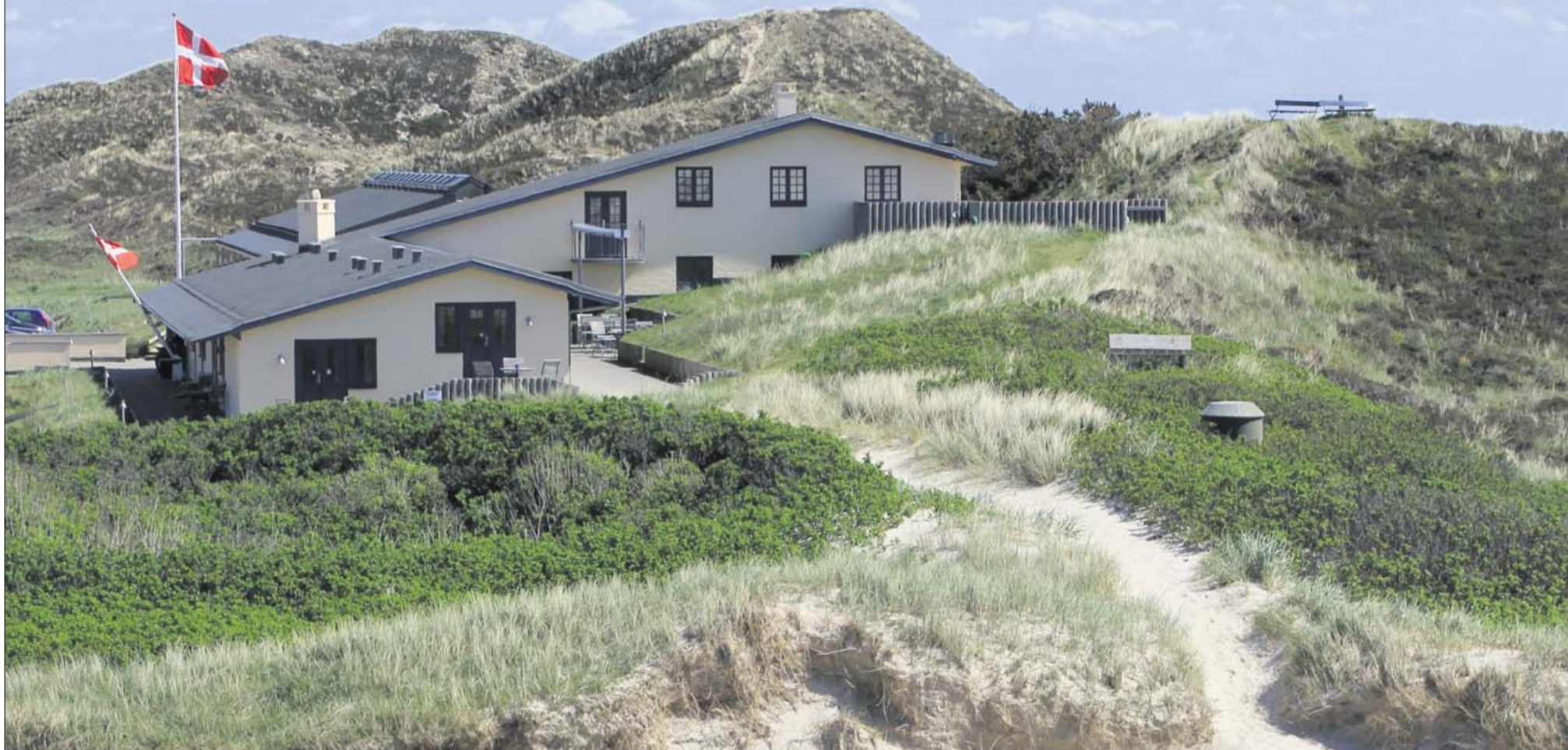
Badehotellet falder særdeles godt ind i den omkringliggende natur.

Arkitekten Poul Henningsen tegnede for over 80 år siden Henne Mølle Å Badehotel, der ligger i yderste klitrække helt ud til Vesterhavet