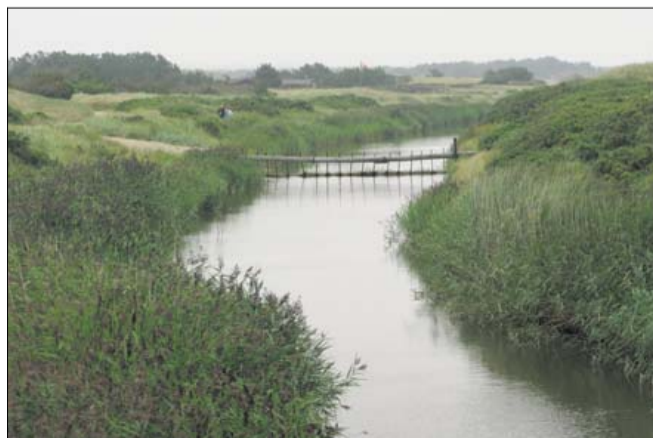
En gåtur langs Henne Mølle Å er en naturskøn oplevelse.

En gåtur langs åen er også en dejlig og naturskøn oplevelse, og generelt er et ophold på det hyggelige badehotel perfekt for dem, der vil slappe af, nyde den friske vesterhavsluft og spise godt på et hotel, der samtidig rummer et interessant og umiskendeligt PH-præg.