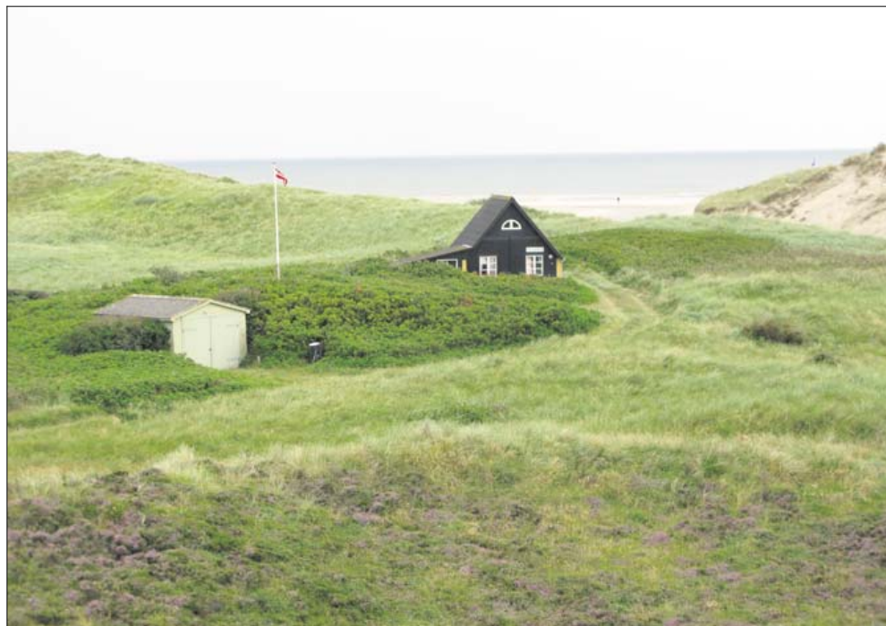
Badehotellet ligger i et fredet område med grønklædte klitter.